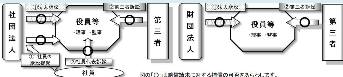
図の「○」は賠償請求に対する補償の可否をあらわします。

役員が善管注意義務や忠実義務等に違反し法人に損害を与えた場合に、法人が役員に対して損害賠償を求める訴えを提起するものです。社団の場合、社員の提訴請求に基づかない法人訴訟等をさします。ただし、保険の適用は「法人訴訟担保特約条項」及び普通保険約款の内容に従います。お支払いできない主な場合として、普通保険約款記載の「役員個人が私的な利益または便宜の供与を違法に得たことに起因する損害賠償請求」や「犯罪行為に起因する損害賠償請求」等が保険適用対象外となります。